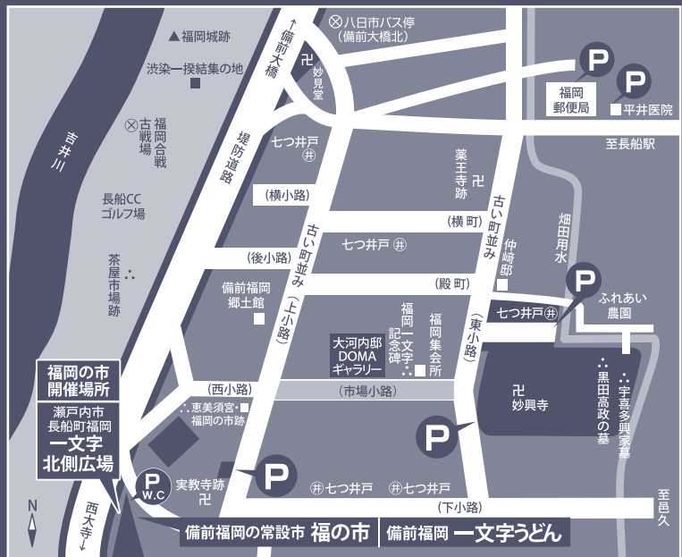
備前福岡町並略図